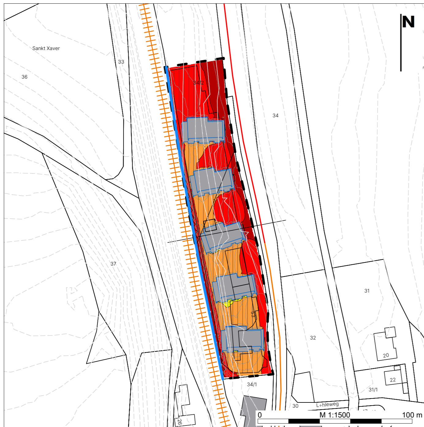
Tagzeitraum (6:00 bis 22:00 Uhr)