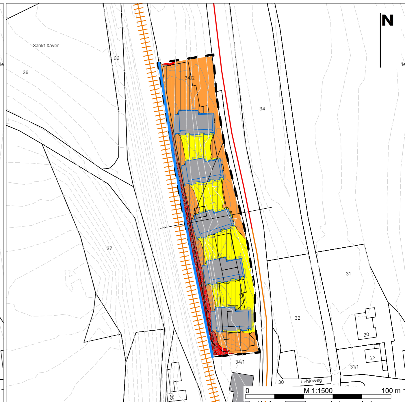
Nachtzeitraum (22:00 bis 6:00 Uhr)