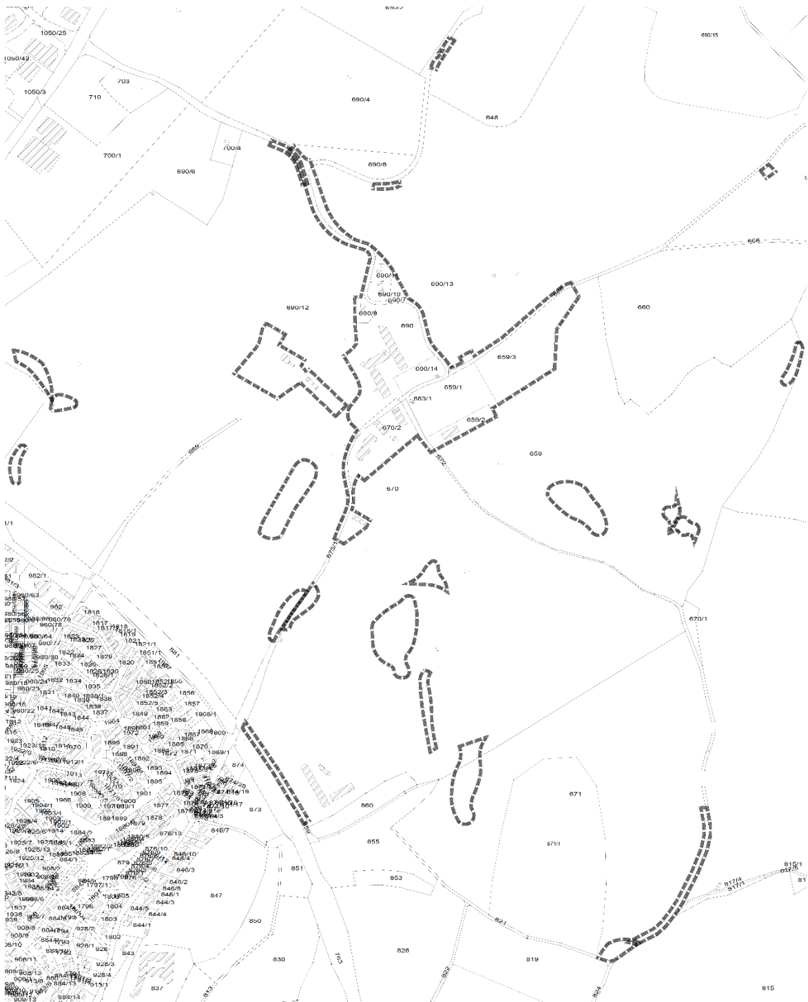
Geltungsbereich Bebauungsplan, Abbildung ohne Maßstab

Für den Eingriff durch den Bebauungsplan werden planexterne Maßnahmen zum Ausgleich erforderlich. Diese werden wie in der nachfolgenden Planzeichnung dargestellt begrenzt: