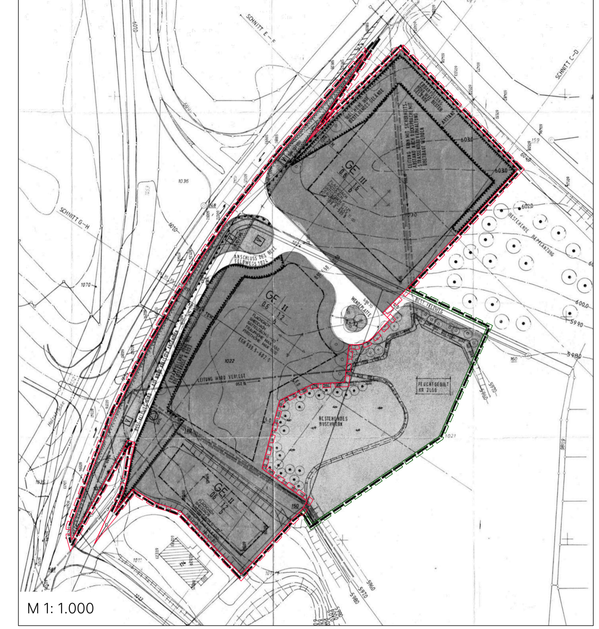
rechtsverbindlicher Bebauungsplan "Gewerbegebiet Biberacher Straße Nord" (Fassung vom 22.06.1987, rechtsverbindlich seit 22.06.1988)