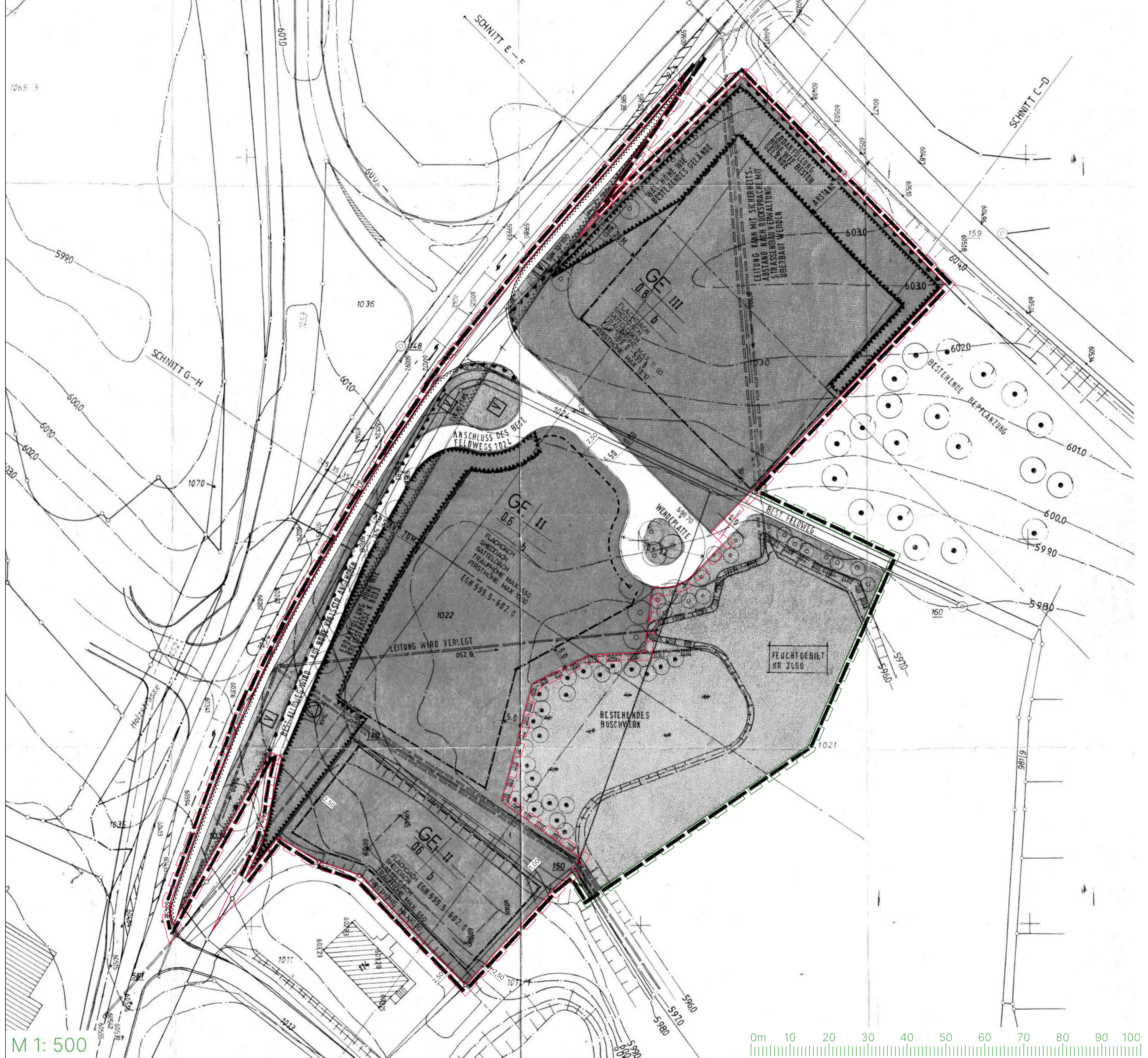
1. Änderung des Bebauungsplanes (BW 124) "Gewerbegebiet Biberacherstraße Nord" und die örtlichen Bauvorschriften hierzu, Gemarkung Waldsee