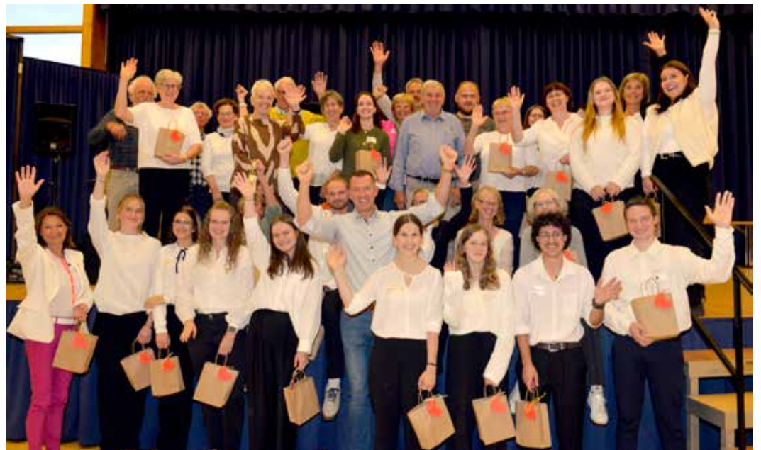
Ein herzlicher Dank an alle Helferinnen und Helfer der Stadt seniorenfahrt 2025.

„Einfach wunderschön“, „Eine tolle Idee der Stadt“ – das Lob für die Organisation und das gemeinsame Erlebnis war einstimmig. Viele Teilnehmende nutzten die Fahrt auch, um sich