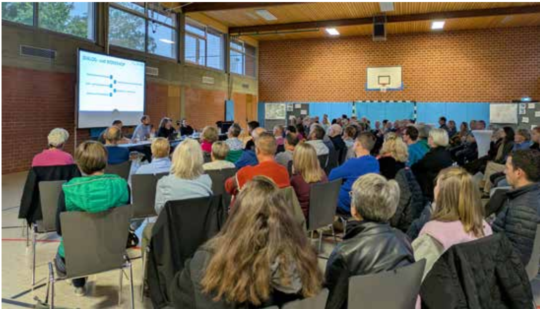
Ein starkes Interesse an der Innenentwicklung von Haisterkirch lockte viele Bürgerinnen und Bürger in die örtliche Gemeindehalle

Mit großem Zulauf ist der Beteiligungsprozess zur Innenentwicklung Haisterkirch gestartet. Bei der Informationsveranstaltung am 24. September 2025 setzte die Stadt Bad Waldsee gemeinsam mit der Bürgerschaft die ersten inhaltlichen Akzente für den Masterplan – von Wohnen über Freiraum bis Mobilität. Die Ergebnisse des Abends und die aktuell laufende Bürgerbefragung (bis 05. Oktober 2025) fließen direkt in die Leistungsbeschreibung der weiteren Planung ein.