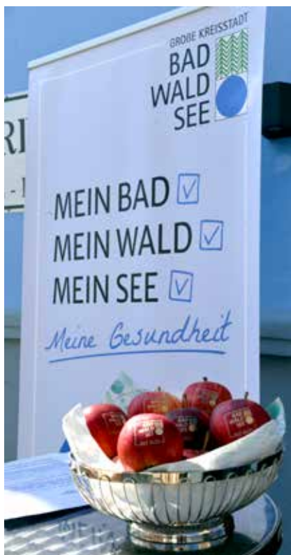
Text und Foto: Brigitte Göppel

Die Ergebnisse fließen direkt in die Planungen der Stadt ein – ob es um mehr Aufenthaltsqualität, gesunde Lebensbedingungen oder neue Freizeitangebote geht.