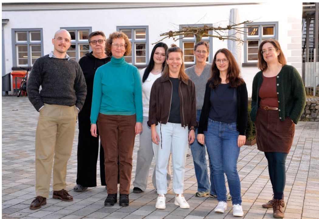
Das Team der Stadtbücherei Bad Waldsee