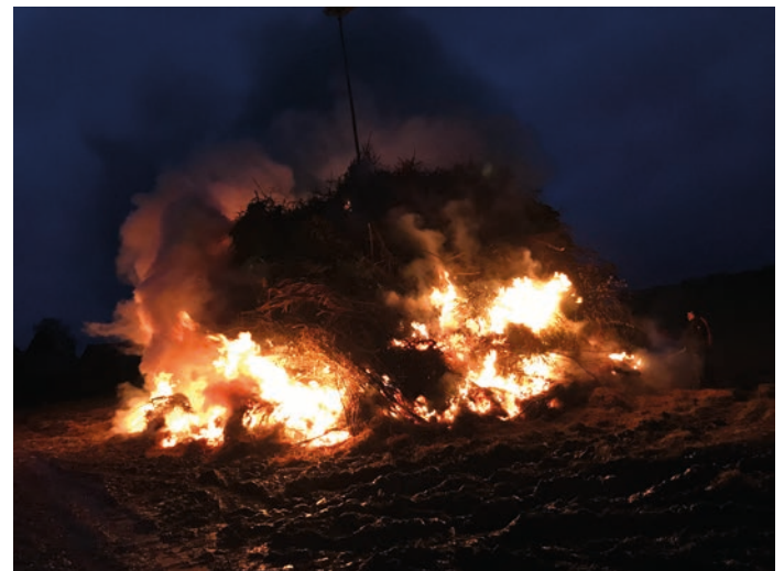
Der Funken wurde entzündet

Ein schönes Frühjahr und ein fruchtbarer Sommer werden sehnsuchtsvoll erwartet.